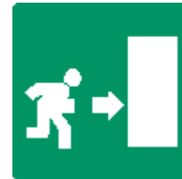
PERCORSO / USCITA DI EMERGENZA