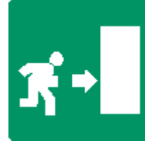
PERCORSO / USCITA DI EMERGENZA